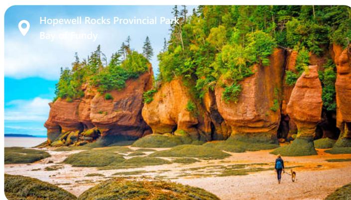
Hopewell Rocks Provincial Park Bay of Fundy

Der er 2 Saint John. Dette er den New brunswick