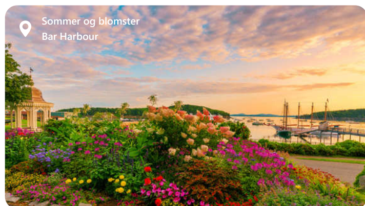
Sommer og blomster Bar Harbour