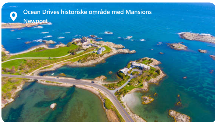
Ocean Drives historiske område med Mansions Newport