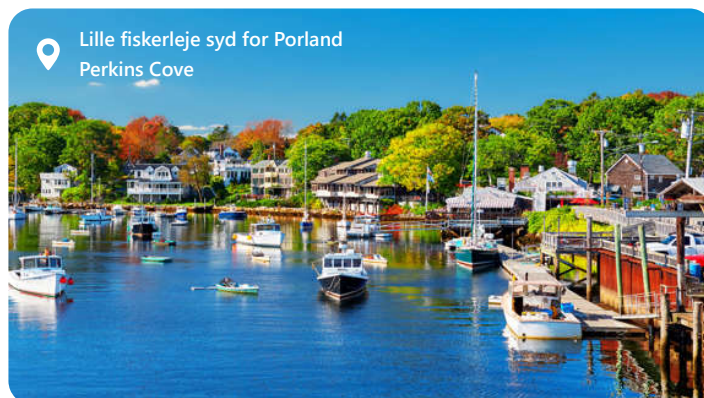
Lille fiskerleje syd for Portland Perkins Cove

Tekst på vej (Portland i staten Maine USA)