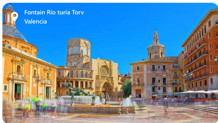
Fontain Rio turia Torv Valencia