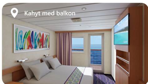
Kahyt med balkon