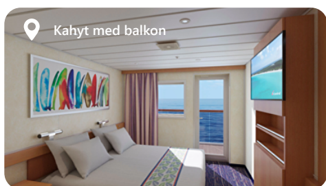
Kahyt med balkon