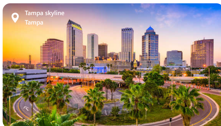
Tampa skyline Tampa

Tampa som er en perle på Floridas vestkyst, er en by fyldt med liv, kultur og historie. Beliggende ved Tampa Bay, byder denne metropol besøgende velkommen med sin varme atmosfære og mangfoldige tilbud. Uanset om man er interesseret i historie, kunst, mad eller sport, er der noget for enhver smag i denne dynamiske by ved Tampa Bay.