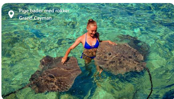
Pige bader med rokker Grand Cayman