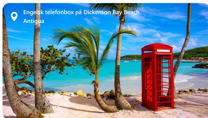
Engelsk telefonbox på Dickenson Bay Beach Antigua

Antigua er en perle i det caribiske øhav, der byder velkommen med en udsøgt caribiske charme. Med sine blændende hvide sandstrande, turkise farvande og frodige landskaber danner St. John rammen om et malerisk paradis. Denne idylliske destination lokker med en afslappet atmosfære, historiske seværdigheder og et væld af udendørs aktiviteter. Udforsk de farverige bygninger, nyd det lokale køkken og fordyb dig i den varme gæstfrihed, der definerer Antigua som en destination, hvor det caribiske liv kan opleves til fulde.