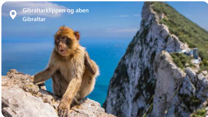
Gibaltarklippen og aben Gibraltar