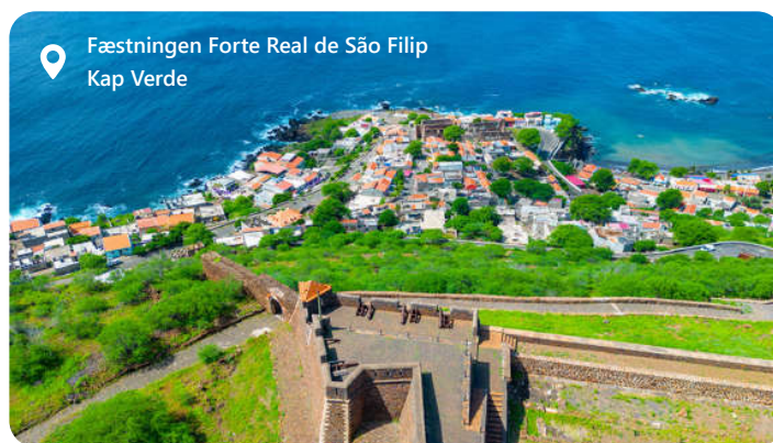
Fæstningen Forte Real de São Filipe Kap Verde

Mindelo, en livlig havneby på Kap Verde-øerne, fortryller besøgende med sin afslappede atmosfære og kulturelle rigdom. Byen er kendt for sin musikscene og farverige byliv. Udforsk lokale seværdigheder som Torre de Belem og Praia da Laginha og nyd autentisk kapverdisk køkken med retter som cachupa og pastel. Mindelo tilbyder en harmonisk blanding af musik og kultur, til dem der ønsker at opleve Kap Verdes charme og nyde den afslappede atmosfære ved Atlanterhavskysten.