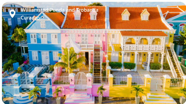
Williamstad Punda and Trobanda Curacao