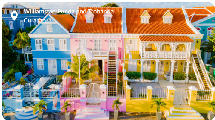
Willemstad Punda and Trobanda Curacao