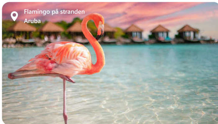
Flamingo på stranden Aruba

Oranjestad, hovedstaden på den caribiske ø Aruba, byder besøgende velkommen med sin farverige arkitektur, smukke strande og afslappede atmosfære. Byen er kendt for sin unikke blanding af hollandsk og caribisk indflydelse, der skaber en charmerende kulturarv. Udforsk lokale seværdigheder som Fort Zoutman og Renaissance Island, og nyd det krystallklare vand på Eagle Beach. Smag lækre caribiske retter som fisketacos og keshi yena.