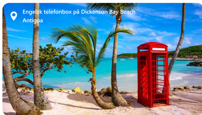
Engelsk telefonbox på Dickenson Bay Beach Antigua

Antigua er en perle i det caribiske øhav, der byder velkommen med en udsøgt caribiske charme. Med sine blændende hvide sandstrande, turkise farvande og frodige landskaber danner St. John rammen om et malerisk paradys. Denne idylliske destination lokker med en afslappet atmosfære, historiske seværdigheder og et væld af udendørs aktiviteter. Udforsk de farverige bygninger, nyd det lokale køkken og fordyb dig i den varme gæstfrihed, der definerer Antigua som en destination, hvor det caribiske liv kan opleves til fulde.