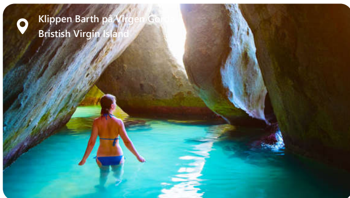
Klippen Barth på Virgin Gorda British Virgin Island