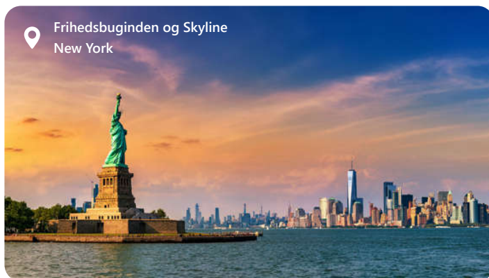
Frihedsbuginden og Skyline New York

New York City, også kendt som "The Big Apple," er en verdensberømt metropol, der symboliserer pulserende energi, kulturel mangfoldighed og utallige muligheder. Beliggende i den nordøstlige del af USA, er byen en sand smeltedigel af kulturer, og dens ikoniske vartegn som Empire State Building, Central Park og Frihedsgudinden trækker besøgende fra hele verden. New York er hjemsted for utallige museer, teatre og gourmetrestauranter samt en af de mest indflydelsesrige økonomiske og finansielle centre globalt. Det er et sted, der aldrig sover, og som aldrig holder op med at overraske og inspirere.