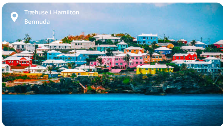
Træhuse i Hamilton Bermuda