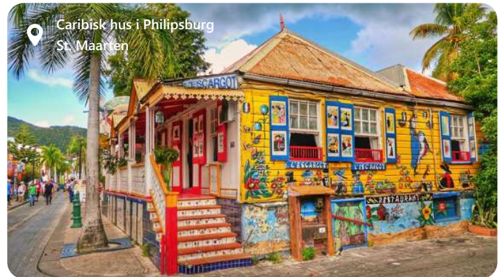
Caribisk hus i Philipsburg St. Maarten

St. Maarten er delt mellem Holland og Frankrig og er derfor en unik blanding af europæisk charme og caribisk skønhed. Philipsburg er hovedstaden i den hollandske del og er en levende og farverig by med en rig historie, pulserende kultur og en spektakulær kystlinje, der tiltrækker både krydstogtgæster og øvrige turister. Kombinationen af historisk charme, moderne bekvemmeligheder og naturlig skønhed gør Philipsburg til en uforglemmelig destination - uanset om du er interesseret i at udforske kulturelle seværdigheder, shoppe, fornøje dig med vandsport eller bare slappe af på stranden.