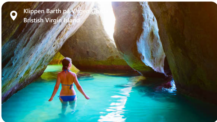
Klippen Barth på Virgen Gorda Bristish Virgin Island