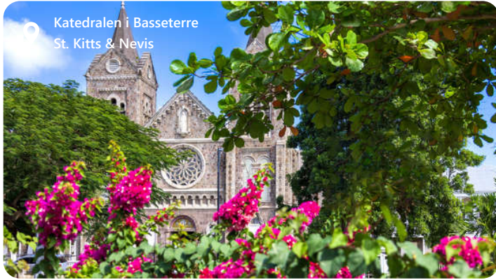
Katedralen i Basseterre St. Kitts & Nevis