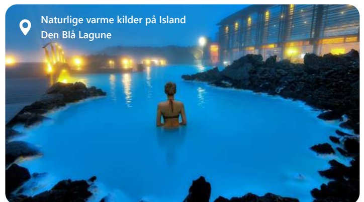
Naturlige varme kilder på Island Den Blå Lagune

Reykjavik, Islands hovedstad, byder dig velkommen til en verden af naturskønhed og kulturel rigdom. Byen er omgivet af majestætiske bjerge, geotermiske varme kilder og det vilde Atlanterhav. Oplev bl.a. den Blå Laguna - en fantastisk oplevelse. Udforsk den fascinerende islandske kultur på museer og gallerier, nyd lokale delikatesser som skaldyr og få en smagsprøve på det pulserende natteliv. Reykjavik er et ideelt udgangspunkt for eventyr i Islands utrolige landskaber. Oplev de storslåede gejsere, vandfald og gletsjere, der gør Island til et unikt rejsemål.