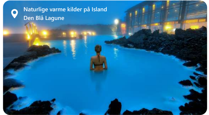
Naturlige varme kilder på Island Den Blå Lagune

Reykjavik, Islands hovedstad, byder dig velkommen til en verden af naturskønhed og kulturel rigdom. Byen er omgivet af majestætiske bjerge, geotermiske varme kilder og det vilde Atlanterhav. Oplev bl.a. den Blå Laguna - en fantastisk oplevelse. Udforsk den fascinerende islandske kultur på museer og gallerier, nyd lokale delikatesser som skaldyr og få en smagsprøve på det pulserende natteliv. Reykjavik er et ideelt udgangspunkt for eventyr i Islands utrolige landskaber. Oplev de storslåede gejsere, vandfald og gletsjere, der gør Island til et unikt rejsemål.