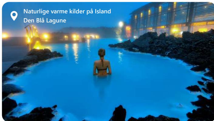
Naturlige varme kilder på Island Den Blå Lagune

Reykjavik, Islands hovedstad, byder dig velkommen til en verden af naturskønhed og kulturel rigdom. Byen er omgivet af majestætiske bjerge, geotermiske varme kilder og det vilde Atlanterhav. Oplev bl.a. den Blå Laguna - en fantastisk oplevelse. Udforsk den fascinerende islandske kultur på museer og gallerier, nyd lokale delikatesser som skaldyr og få en smagsprøve på det pulserende natteliv. Reykjavik er et ideelt udgangspunkt for eventyr i Islands utrolige landskaber. Oplev de storslåede gejsere, vandfald og gletsjere, der gør Island til et unikt rejsemål.