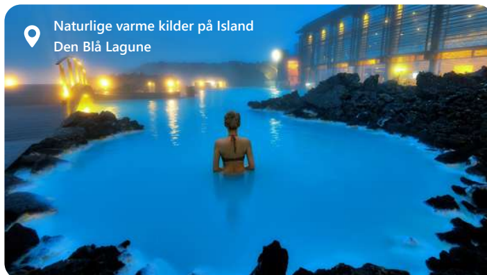
Naturlige varme kilder på Island Den Blå Lagune

Reykjavik, Islands hovedstad, byder dig velkommen til en verden af naturskønhed og kulturel rigdom. Byen er omgivet af majestætiske bjerge, geotermiske varme kilder og det vilde Atlanterhav. Oplev bl.a. den Blå Laguna - en fantastisk oplevelse. Udforsk den fascinerende islandske kultur på museer og gallerier, nyd lokale delikatesser som skaldyr og få en smagsprøve på det pulserende natteliv. Reykjavik er et ideelt udgangspunkt for eventyr i Islands utrolige landskaber. Oplev de storslåede gejsere, vandfald og gletsjere, der gør Island til et unikt rejsemål.