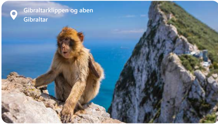
Gibraltarklippen og aben Gibraltar