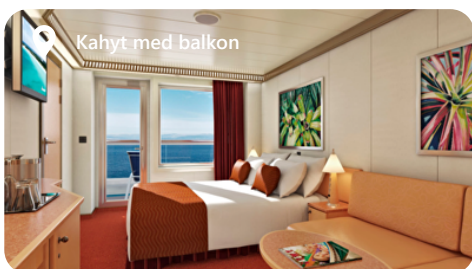
Kahyt med balkon