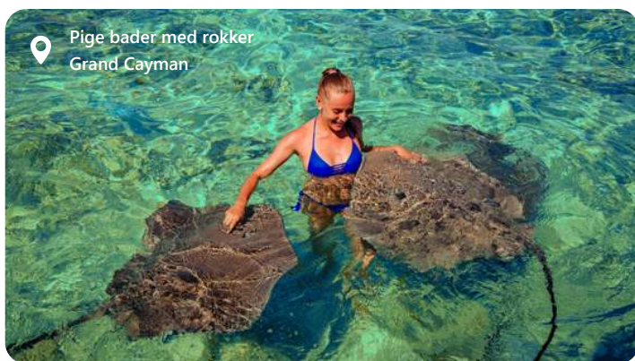
Pige bader med rokker Grand Cayman