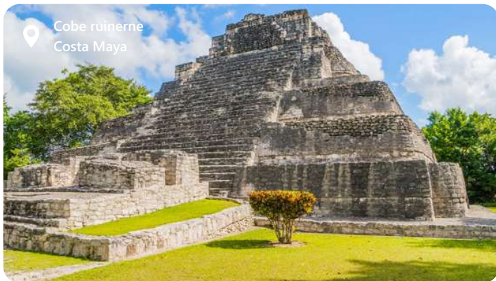
Cobe ruinerne Costa Maya