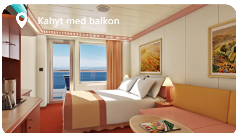
Kahyt med balkon