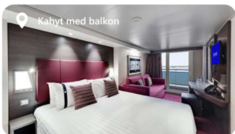
Kahyt med balkon

OB - Udvendig Bella, Uspecificeret OL2 - Udvendig Fantastica, Premium OM2 - Udvendig Fantastica, junior OO - Udvendig Fantastica, med begrænset udsigt OR1 - Udvendig Fantastica, Deluxe