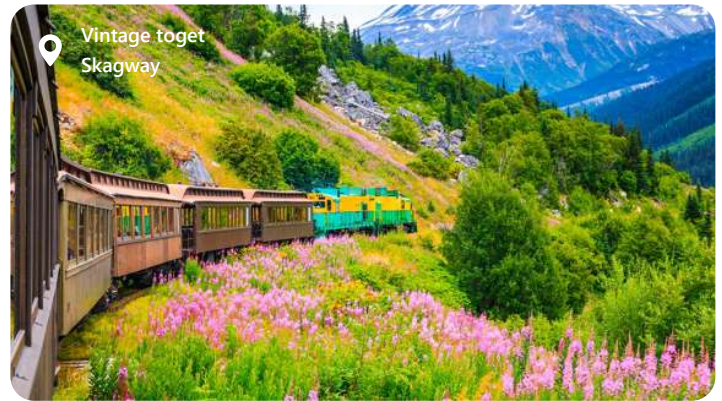
Vintage toget Skagway

Skagway blomstrede op under guldfieberen, men i dag har byen kun omkring 1.000 indbyggere. Den har dog bibeholdt atmosfæren fra dengang og fremstår lidt som en "historisk museumsby", hvor du tages med tilbage i tiden. Skagway har også en af verdens stejleste jernbaner, hvor du med vintage tog kan følge i guldgraverens fodspor til Klondike, mens du begejstres af den formidable udsigt til bjerge, kløfter, gletsjere, vandfald, tunneller og broer.