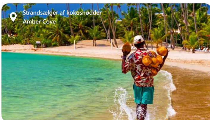
Strandsælger af kokosnødder Amber Cove

byder området også på smukke strande, fiskemuligheder og rekreative aktiviteter. Besøgende kan udforske en spændende blanding af rumfarts- og maritime kulturer og nyde solen, sandet og havnelivet i Port Canaveral.