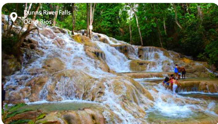
Dunn's River Falls Ocho Rios