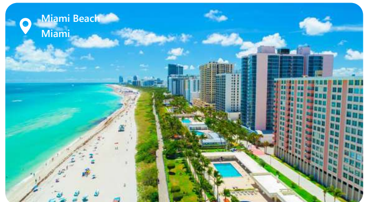
Miami Beach Miami

Miami ligger på Floridas solbeskinnede kyst og fortryller besøgende med sin moderne stil og pulserende atmosfære. Byen er kendt for sine smukke strande, spændende kunstscene og mangfoldige kulturliv. Udforsk lokale seværdigheder som Art Deco Historic District og Wynwood Walls og nyd både det autentiske amerikanske og latinamerikanske køkken. Miami tilbyder en harmonisk blanding af glamour og kultur, det bedste af den sydfloridianske livsstil og skønt vejr.