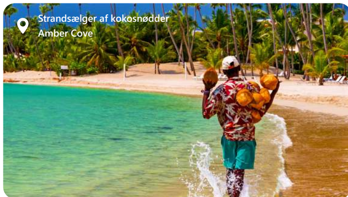
Strandsælger af kokosnødder Amber Cove

Amber Cove er en strålende perle beliggende på den nordlige kyst af Den Dominikanske Republik, tæt på byen Puerto Plata. Denne moderne krydstogthavn, som åbnede i 2015, er udviklet af Carnival Corporation og har hurtigt etableret sig som et af Caribiens mest populære rejsemål for krydstogtspassagerer. Med sin betagende naturlige skønhed, rige kulturhistorie og en bred vifte af aktiviteter er Amber Cove et ideelt sted for en uforglemmelig ferieoplevelse.