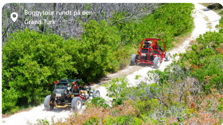
Buggytour rundt på øen Grand Turk