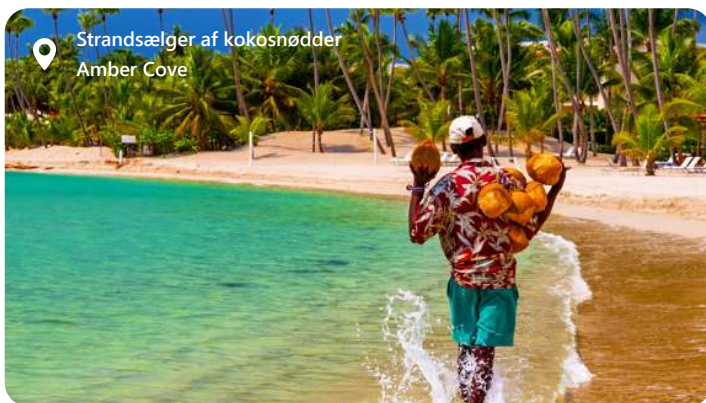
Strandsælger af kokosnødder Amber Cove

can play in the turquoise seas, ride horseback on powdery white sand, and encounter silky-smooth stingrays. If your wish list includes a cruise to private island serenity — and it should — Half Moon Cay is a must.