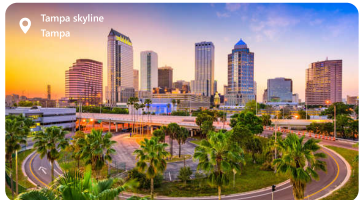
Tampa skyline Tampa

Tampa som er en perle på Floridas vestkyst, er en by fyldt med liv, kultur og historie. Beliggende ved Tampa Bay, byder denne metropol besøgende velkommen med sin varme atmosfære og mangfoldige tilbud. Uanset om man er interesseret i historie, kunst, mad eller sport, er der noget for enhver smag i denne dynamiske by ved Tampa Bay.