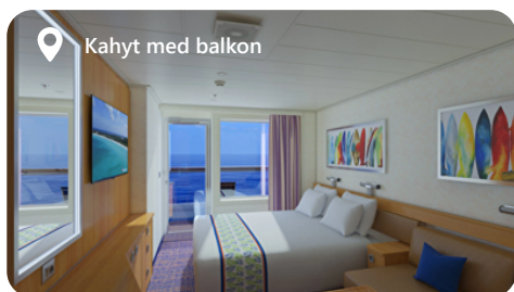
Kahyt med balkon