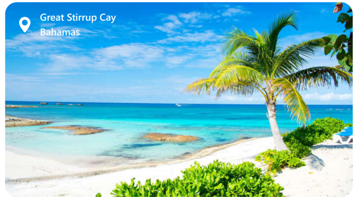
Great Stirrup Cay Bahamas

Great Stirrup Cay er en uberørt juvel blandt de bahamiske øer. Beliggende i den nordlige del af Berry Islands, er denne lille ø et paradys af hvidt sand og azurblåt vand. Ejet af Norwegian Cruise Line, er øen en eksklusiv destination for deres krydstogtpassagerer, der søger en dag med afslapning og eventyr.