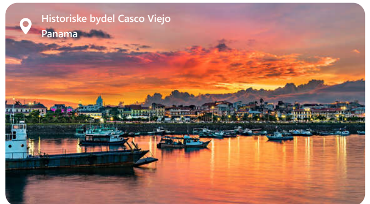
Historiske bydel Casco Viejo Panama