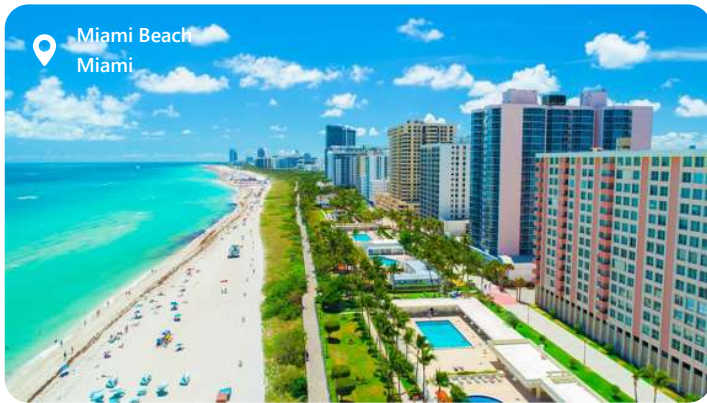
Miami Beach Miami