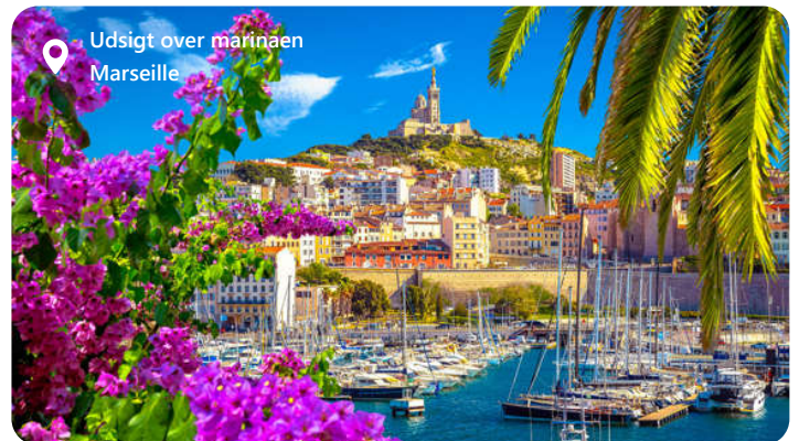
Udsigt over marinaen Marseille

Marseille, en fascinerende havneby i det sydlige Frankrig, imponerer besøgende med sin maritime skønhed og kulturelle rigdom. Byen er kendt for sin historiske arv og den pulserende atmosfære. Udforsk lokale seværdigheder som Basilique Notre-Dame de la Garde og Vieux-Port, og nyd autentisk fransk køkken med lækre retter som bouillabaisse og ratatouille. Marseille tilbyder en harmonisk blanding af kultur og havn, hvilket gør den til en ideel destination for dem, der ønsker at udforske det bedste af det sydfranske kystliv og fordybe sig i historie og kultur.