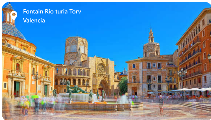
Fontain Rio turia Torv Valencia

Valencia er en smuk region beliggende på den østlige kyst af Spanien, er en skatkiste af historie, kultur og naturskønhed. Med sin fascinerende blanding af middelalderlige monumenter, moderne arkitektur og strålende strande er Valencia en magnet for rejsende fra hele verden. Hjemsted for den berømte paella-ret, byder regionen på en udsøgt kulinarisk oplevelse. Den årlige Las Fallas-festival er et imponerende skue med farverige optog og spektakulære fyrværkeri. Valencia er også kendt for sin arkitektoniske perle, City of Arts and Sciences. Dette sted er et paradis for kunst- og videnskabsentusiaster. Valencia er kort sagt en destination, der fusionerer fortidens pragt med nutidens dynamik og naturens skønhed.