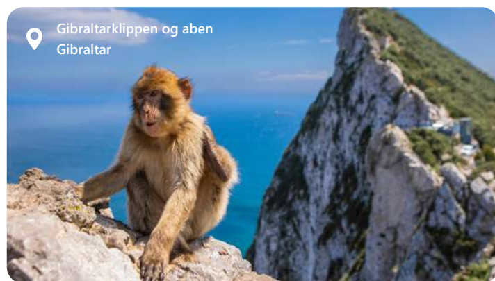
Gibaltarklippen og aben Gibraltar