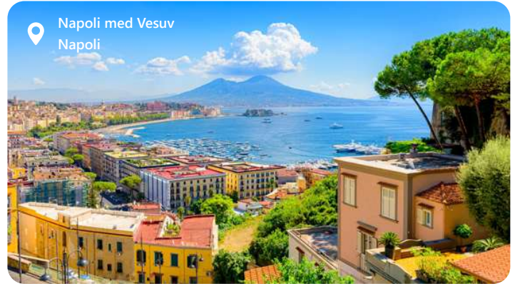
Napoli med Vesuv Napoli

Napoli er en perle i det sydlige Italien, som er en by, der oser af historie, kultur og charme. Berømt for sin enestående beliggenhed ved Middelhavets kyst, byder Napoli på smukke udsigter over havet og de majestætiske Vesuv. Byen er kendt for sin rige kulinariske arv, hvor autentisk pizza og saftige pasta retter stjæler hjertet på enhver besøgende. Napoli er også hjemsted for en skattekasse af historiske skatte, herunder UNESCO-verdensarvsteder og fascinerende museer, der vidner om byens imponerende fortid og kulturelle betydning.