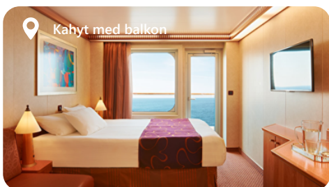
Kahyt med balkon

E1 - Havudsigt E2 - Havudsigt EC - Klassisk Udvendig Med Havudsigt EP - Premium Udvendig Med Havudsigt EV - Udvendig Garanti Oceanview Group ( E1 + E2 )