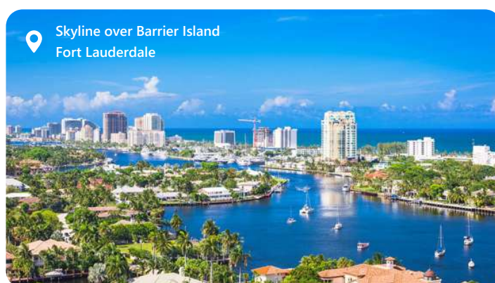
Skyline over Barrier Island Fort Lauderdale

Fort Lauderdale, ofte omtalt som "Venedig i Amerika" på grund af sine mange kanaler og vandveje, er en solrig perle i den sydlige del af Florida, tæt på Miami. Byen er kendt for sine betagende strande, luksuriøse feriesteder og pulserende natteliv. Fort Lauderdale tiltrækker besøgende med sine blide klima og utallige udendørsaktiviteter, herunder sejlsport og vandsport i det krystallklare Atlanterhav. Den charmerende Las Olas Boulevard byder på shopping og spisning i verdensklasse. Fort Lauderdale er også en vigtig krydstogthavn og et ideelt udgangspunkt for at udforske det sydlige Florida, herunder Miami, Everglades og de tropiske nøgleøer.