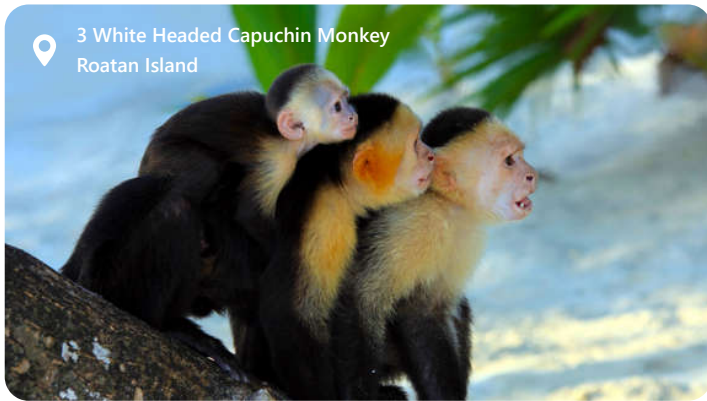
3 White Headed Capuchin Monkey Roatan Island