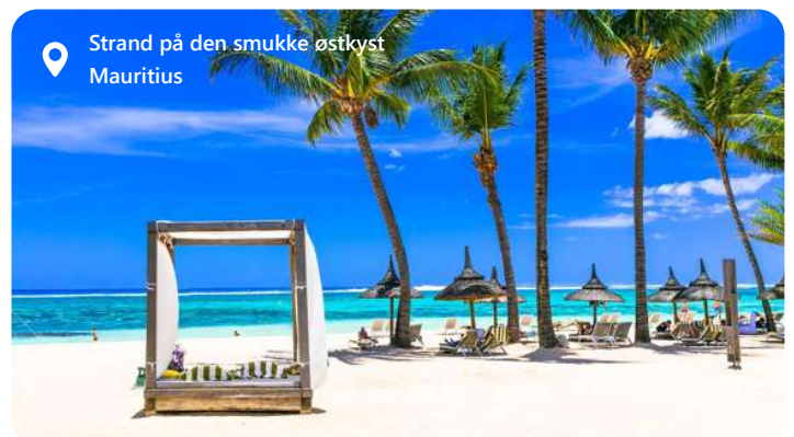
Strand på den smukke østkyst Mauritius

Port Louis er hovedstaden i den idylliske ø-nation Mauritius i Det Indiske Ocean, som er en by, der kombinerer en fascinerende blanding af kulturarv og naturskønhed. Med sin travle havn og imponerende skyline er Port Louis hjertet af øens økonomi og handel. Byen oser af kulturel mangfoldighed med sine farverige markeder, historiske monumenter og kulinariske skatte. Samtidig er Port Louis omgivet af betagende kyststrækninger og frodige bjerglandskaber, hvilket gør den til et perfekt udgangspunkt for at udforske Mauritius' unikke naturskønhed og rige kulturarv.