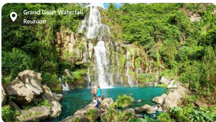
Grand Galat Waterfall Reunion