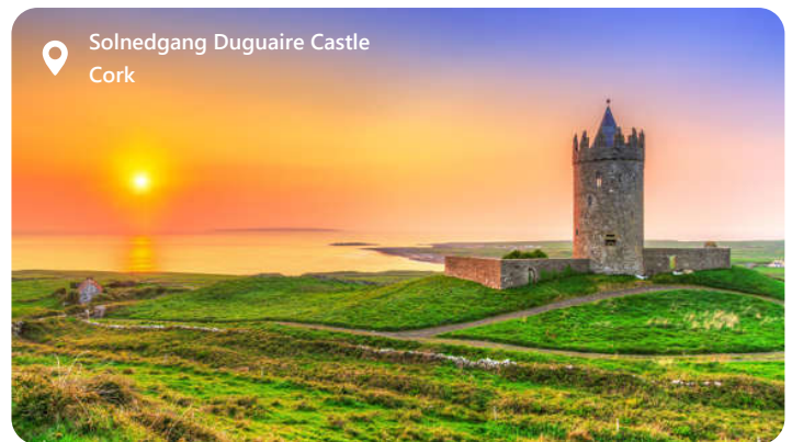
Solnedgang Duguaire Castle Cork

Cork er en skatkiste af autentiske irske oplevelser.