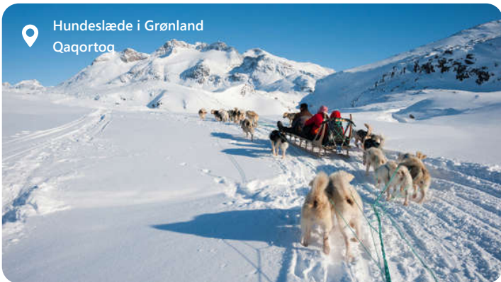
Hundeslæde i Grønland Qaortoq