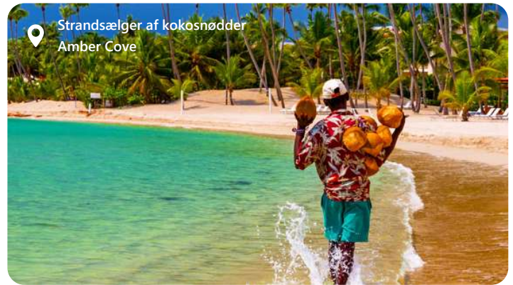
Strandsælger af kokosnødder Amber Cove

Amber Cove er en strålende perle beliggende på den nordlige kyst af Den Dominikanske Republik, tæt på byen Puerto Plata. Denne moderne krydstogthavn, som åbnede i 2015, er udviklet af Carnival Corporation og har hurtigt etableret sig som et af Caribiens mest populære rejsemål for krydstogtspassagerer. Med sin betagende naturlige skønhed, rige kulturhistorie og en bred vifte af aktiviteter er Amber Cove et ideelt sted for en uforglemmelig ferieoplevelse.