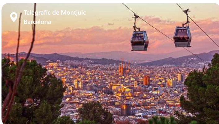
Telegrafic de Montjuic Barcelona