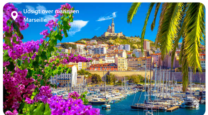
Udsigt over marinaen Marseille

Marseille, en fascinerende havneby i det sydlige Frankrig, imponerer besøgende med sin maritime skønhed og kulturelle rigdom. Byen er kendt for sin historiske arv og den pulserende atmosfære. Udforsk lokale seværdigheder som Basilique Notre-Dame de la Garde og Vieux-Port, og nyd autentisk fransk køkken med lækre retter som bouillabaisse og ratatouille. Marseille tilbyder en harmonisk blanding af kultur og havn, hvilket gør den til en ideel destination for dem, der ønsker at udforske det bedste af det sydfranske kystliv og fordybe sig i historie og kultur.