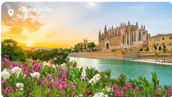
Katedral Le Seu Mallorca