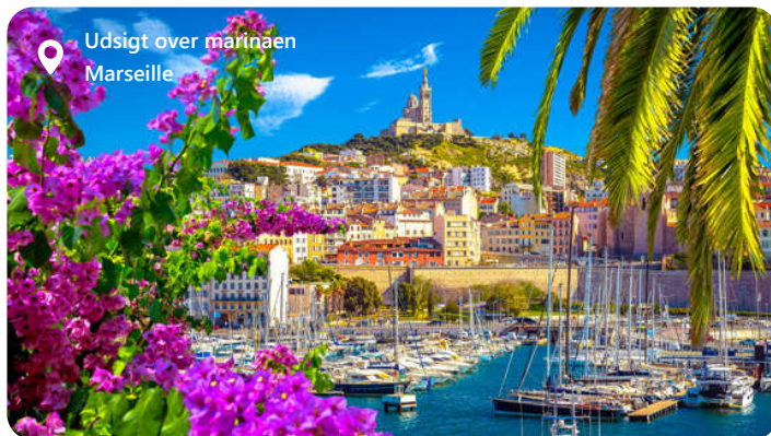
Udsigt over marinaen Marseille

Marseille, en fascinerende havneby i det sydlige Frankrig, imponerer besøgende med sin maritime skønhed og kulturelle rigdom. Byen er kendt for sin historiske arv og den pulserende atmosfære. Udforsk lokale seværdigheder som Basilique Notre-Dame de la Garde og Vieux-Port, og nyd autentisk fransk køkken med lækre retter som bouillabaisse og ratatouille. Marseille tilbyder en harmonisk blanding af kultur og havn, hvilket gør den til en ideel destination for dem, der ønsker at udforske det bedste af det sydfranske kystliv og fordybe sig i historie og kultur.