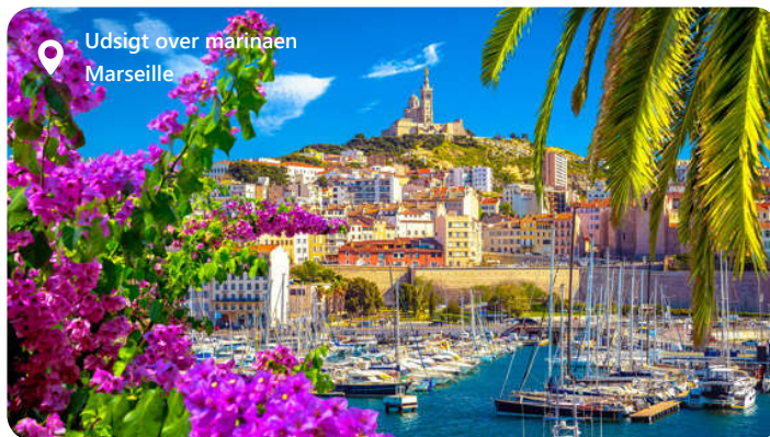
Udsigt over marinaen Marseille

Marseille, en fascinerende havneby i det sydlige Frankrig, imponerer besøgende med sin maritime skønhed og kulturelle rigdom. Byen er kendt for sin historiske arv og den pulserende atmosfære. Udforsk lokale seværdigheder som Basilique Notre-Dame de la Garde og Vieux-Port, og nyd autentisk fransk køkken med lækre retter som bouillabaisse og ratatouille. Marseille tilbyder en harmonisk blanding af kultur og havn, hvilket gør den til en ideel destination for dem, der ønsker at udforske det bedste af det sydfranske kystliv og fordybe sig i historie og kultur.