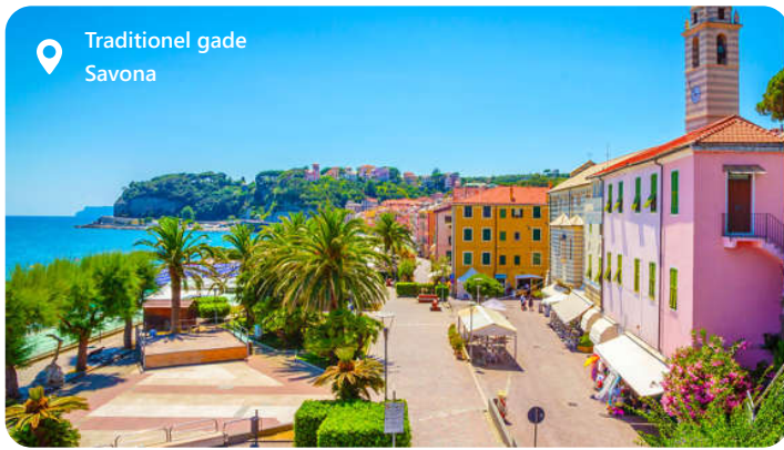
Traditionel gade Savona