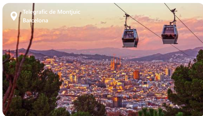
Telegrafic de Montjuic Barcelona

Barcelona - en charmerende metropol og hovedstad i det katalanske Nordspanien. Byen er en sand perle hvor historie og nutid forenes i perfekt harmoni. Særligt Gaudís fascinerende mesterværker som La Sagrada Família og Park Güell, tager enhver med storm. Byen stråler af kulturel rigdom med kunstgallerier, museer og et livligt gademiljø. De gyldne sandstrande langs kysten og den fortryllende gotiske kvarter skaber en atmosfære, der indfanger hjertet og sindet. Barcelona er ikke blot en by, det er en oplevelse.