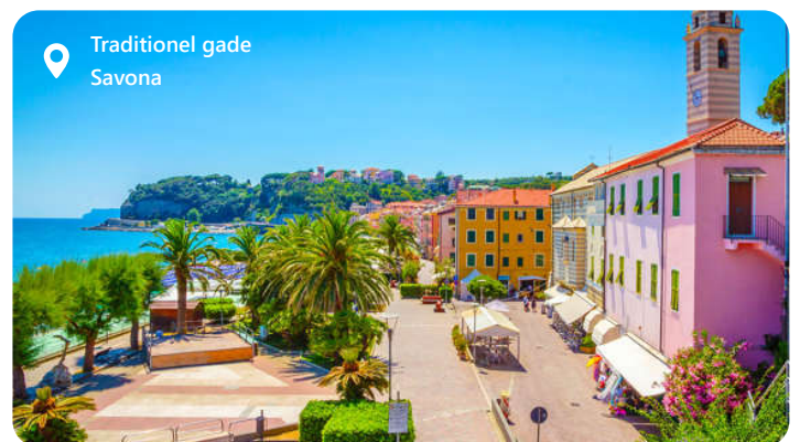
Traditionel gade Savona

Savona byder dig velkommen med sin skønhed og historiske charme. Byen er Costa Cruises base, og derfor kommer mange af deres skibe også i land her. Savona er en destination, der byder på solrige strande og en gammel bydel der er fyldt med smalle gader og fascinerende arkitektoniske perler. Nyd de lækre italienske retter på lokale restauranter, og oplev den varme og gæstfri atmosfære i denne fantastiske by. Ikke langt fra Savona er der et rigt udbud af oplevelser. For de eventyrlystne er der inde i baglandet Via Ferrata degli Artist. Hele kyststrækningen kaldes Ligurien og byder på fortryllende små åndehuller. Men mest af alt er det vær at opleve de 5 små kystbyer ved Cinque Terre.