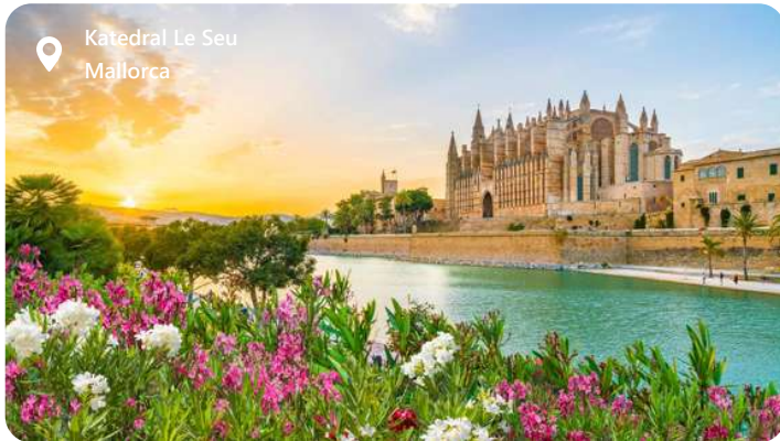
Katedral Le Seu Mallorca