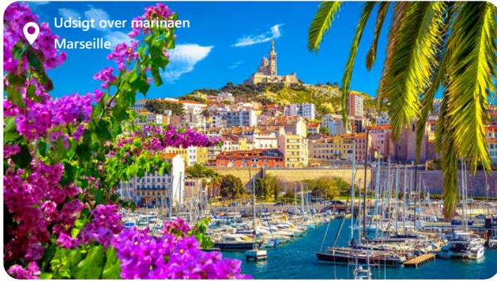
Udsigt over marinaen Marseille