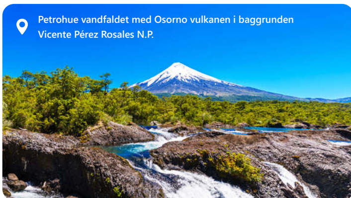
Petrohue vandfaldet med Osorno vulkanen i baggrunden Vicente Pérez Rosales N.P.

smelter fortid og nutid sammen med imponerende arkitektur og pulserende kultur. Belliggende omgivet af Andesbjergene, tilbyder Santiago en enestående udsigt og udendørs eventyr.